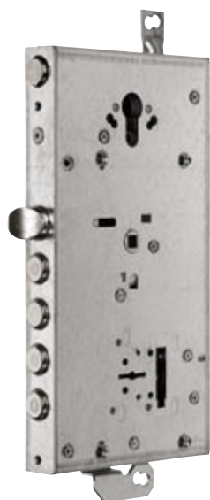
Сувальдный перекодируемый замок MATRIX®, легкая перекодировка путем смены Sim-карты

Сувальдный замок MATRIX со сменной Sim-картой. Первый в мире перекодируемый сувальдный замок с зубчато-реечным механизмом. Устойчив к силовому воздействию, абсолютно бесшумен; отсутствует износ ключей. Легкая перекодировка путем смены Sim-карты.