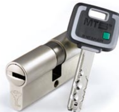
Механический цилиндр нового поколения MT5+, число секретных комбинаций которого превышает 100 млрд

Мастер-системы Mul-T-Lock. Сегодня наряду с основными характеристиками становится важным и комфорт при пользовании замками. В больших зданиях особенно актуальна проблема огромных связок ключей от разных дверей.